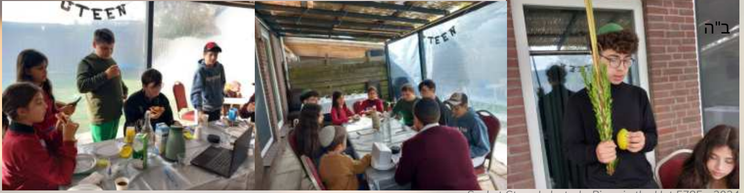
Soekot Cteen Lelystad - Pizza in the Hut 5785 - 2024