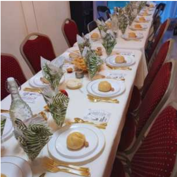
Gedekte tafel voor het Rosj HaSjanadiner in Lelystad