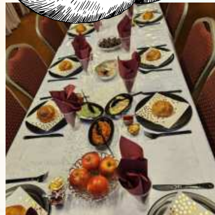
De tafel is mooi gedekt