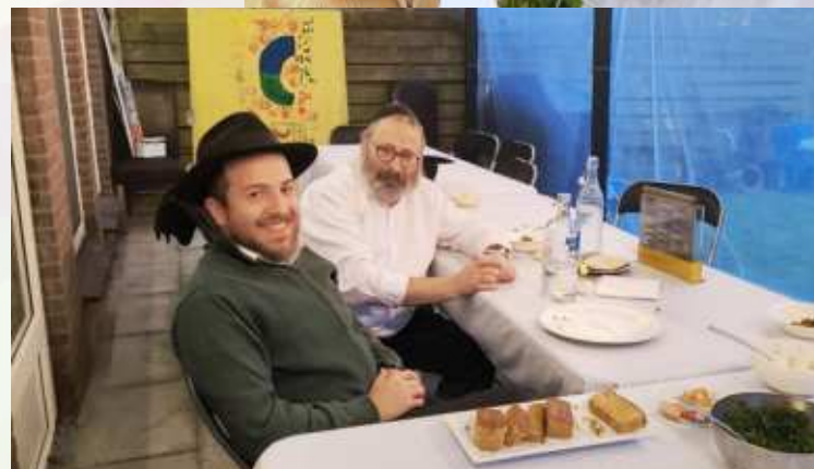
Soeka bouwen in Lelystad