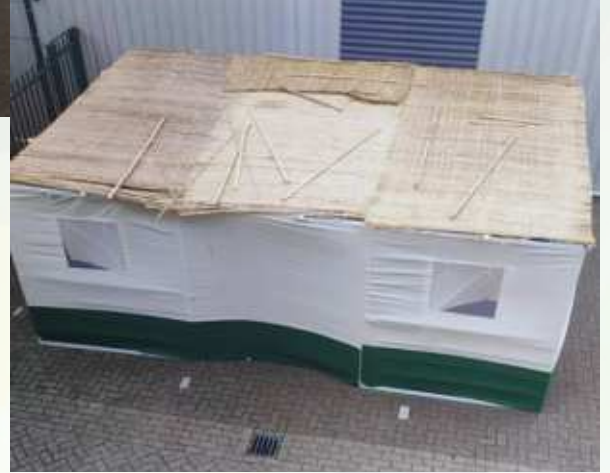
Soeka bouwen bij het Chabad Center Almere