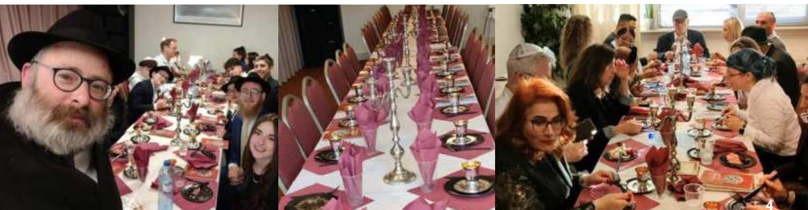
Prachtig versierde tafel voor de Seidermaaltijd