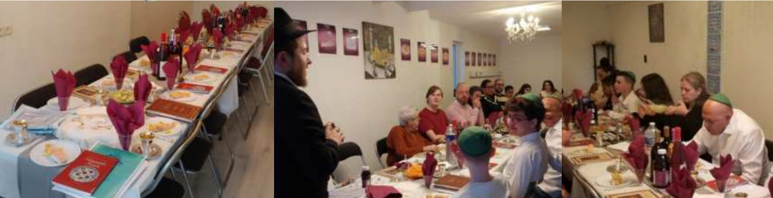
De seidermaaltijd in Lelystad

In Lelystad vieren ze ook Seider met een bomvolle tafel, met zelfs meer gasten dan in Almere, bij de familie Shusterman. Al met al kijken we terug op een geslaagde Pesach in de polder.