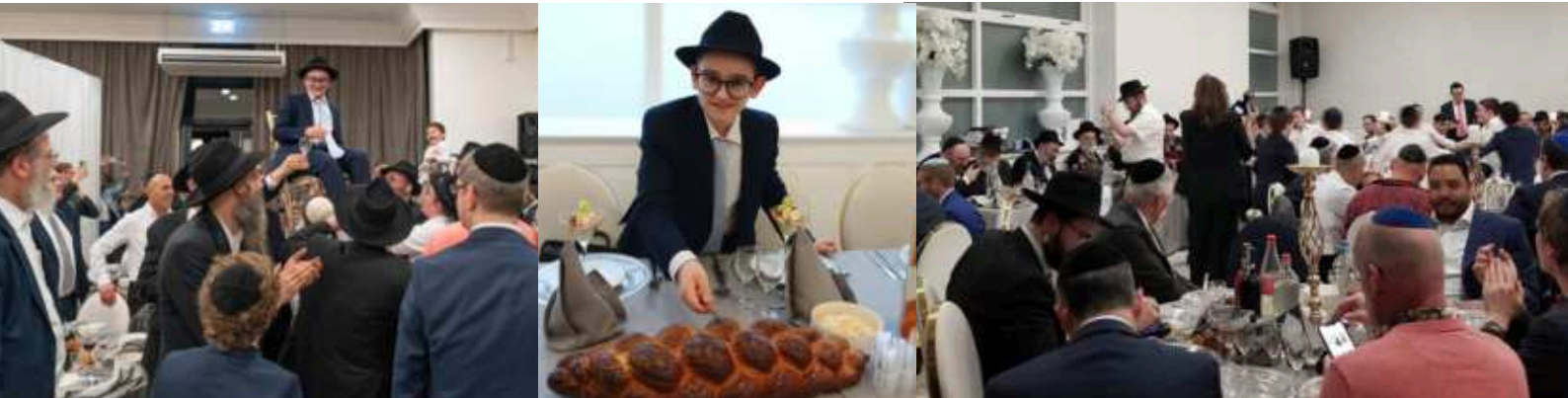
Vreugde op het feest

Omdat veel gasten tijdens Pesach blijven logeren, is er de hele week drie keer minjan. Een hele mooie en bijzondere situatie voor Flevoland.