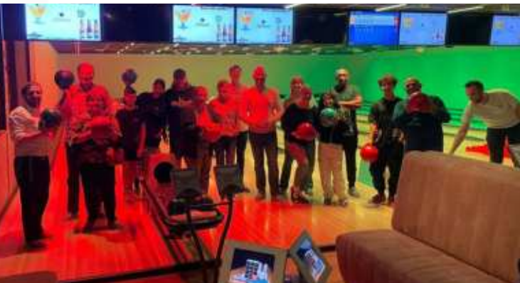
Bowling middag met Chabad Lelystad