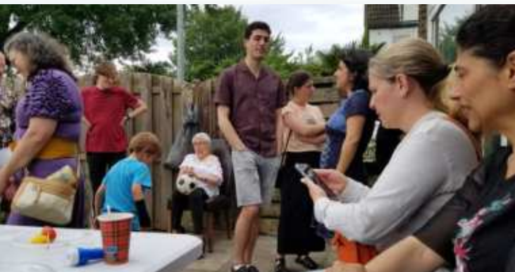
Lag Ba'Omer BBQ in Lelystad

Tijdens de jaarvergadering op zondag 12 mei besluiten we om een paar geliefde en actieve programma's uit het verleden weer nieuw leven in te blazen. Zo hopen we weer veel vreugde en gezelligheid terug te brengen.